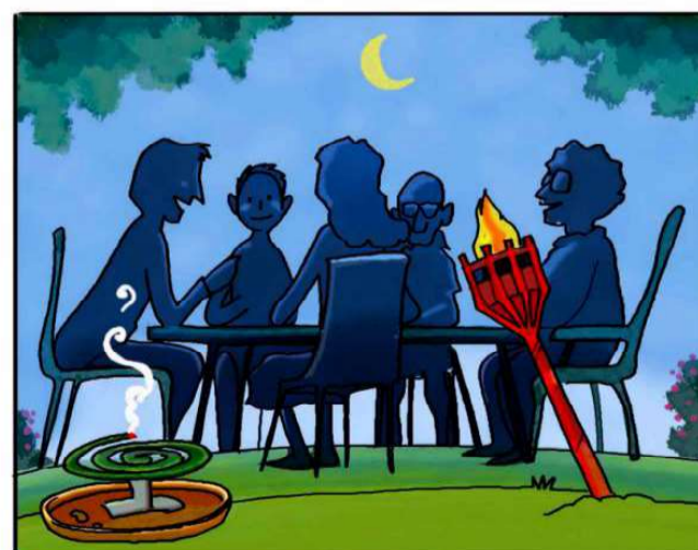
QUANDO SOGGIORNI ALL'APERTO, PROTEGGITI CON REPELLENTI AMBIENTALI. (*)

(*) Leggi attentamente le istruzioni riportate sulle confezioni.