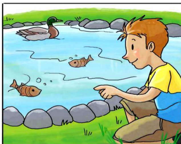
INTRODUCI I PESCI IN VASCHE E FONTANE.