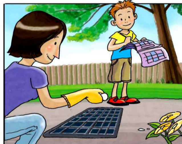
RICORDATI DI TRATTARE I TOMBINI CON PASTIGLIE DI INSETTICIDA, NEL PERIODO DA APRILE A SETTEMBRE. (*)